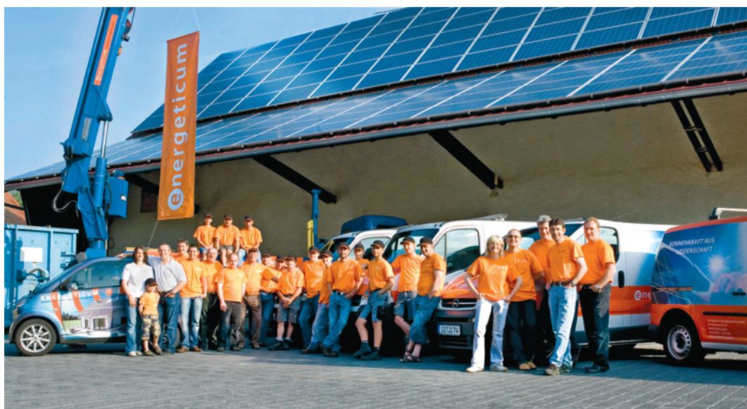
Das Team der Energeticum GmbH