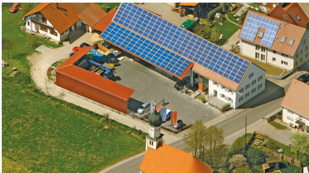
Der Firmensitz im Süden Balzhausens, nur einen Steinwurf von der St.-Leonhards-Kapelle entfernt.